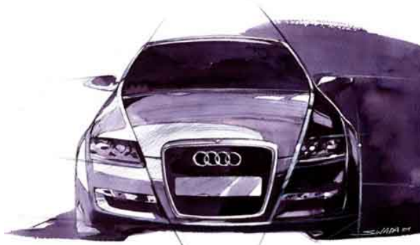
AUDI A6 シングルフレームの初採用モデル